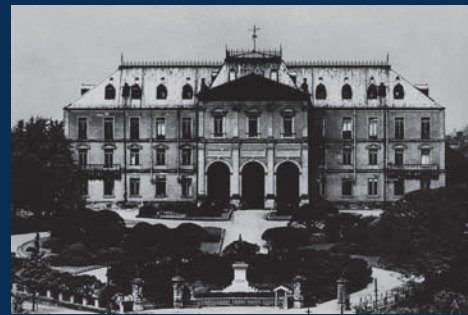
陸地測量部 (東京三宅坂)