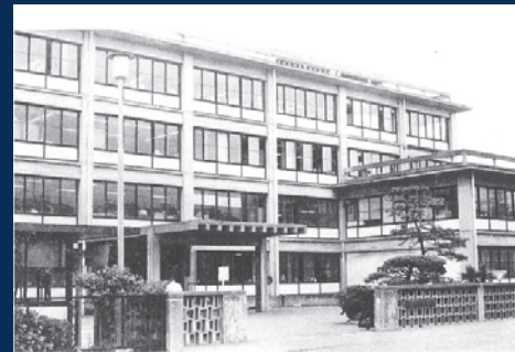
地理調査所 (東京都目黒区)