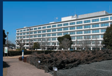
国土地理院本院 (茨城県つくば市)