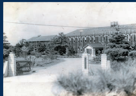
地理調査所 (千葉県千葉市)