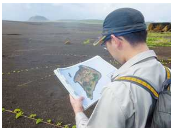
空中写真から判読できないものを確認