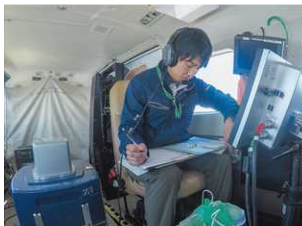
地図作成に必要な空中写真を撮影