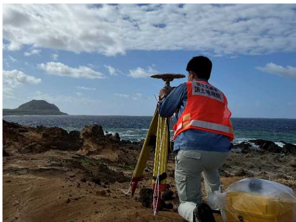
位置の基準となる測量を実施