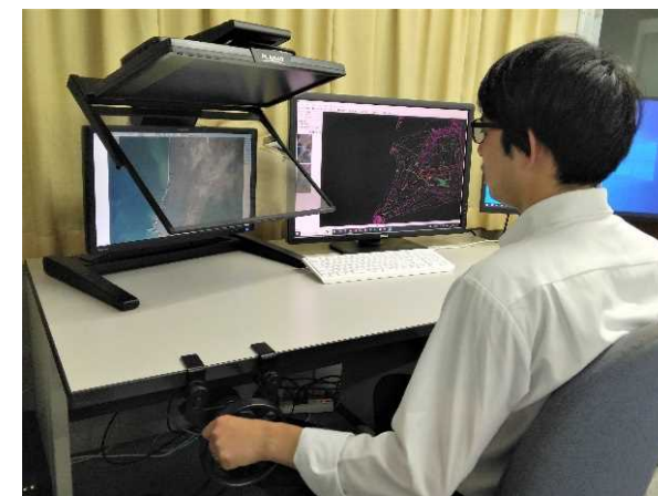
空中写真から海岸線、等高線などを図化