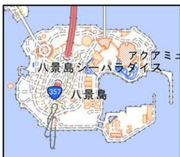
埋立による陸地（八景島）