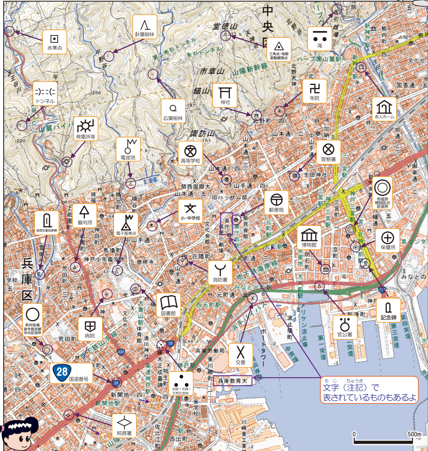
電子地形図25000(令和2年9月26日調整)を拡大