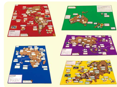
第23回 審査員特別賞