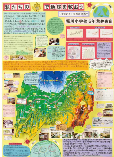
第23回 文部科学大臣賞