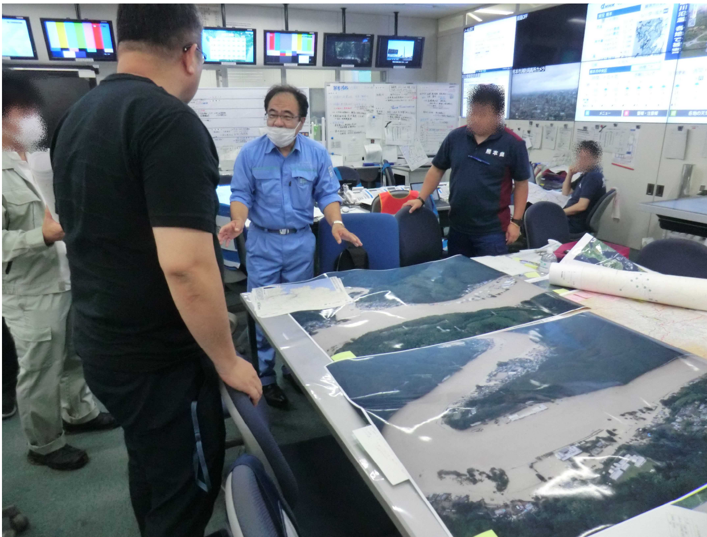
【熊本県庁】提供した空中写真（斜め写真）について説明する隊員（写真中央）7月5日撮影

国土地理院TEC-FORCE（リエゾン）は熊本県災害対策本部に地理空間情報の提供を実施しました。