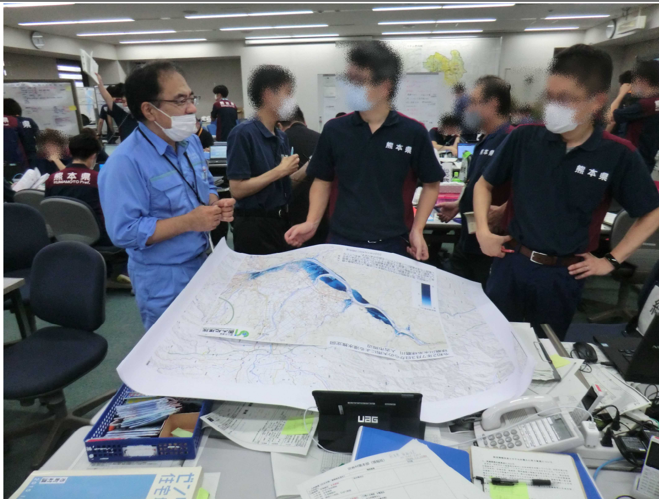
【熊本県庁】提供した浸水推定図について説明する隊員（写真左）7月4日撮影

国土地理院TEC-FORCE（リエゾン）は熊本県災害対策本部に地理空間情報の提供を実施しました。