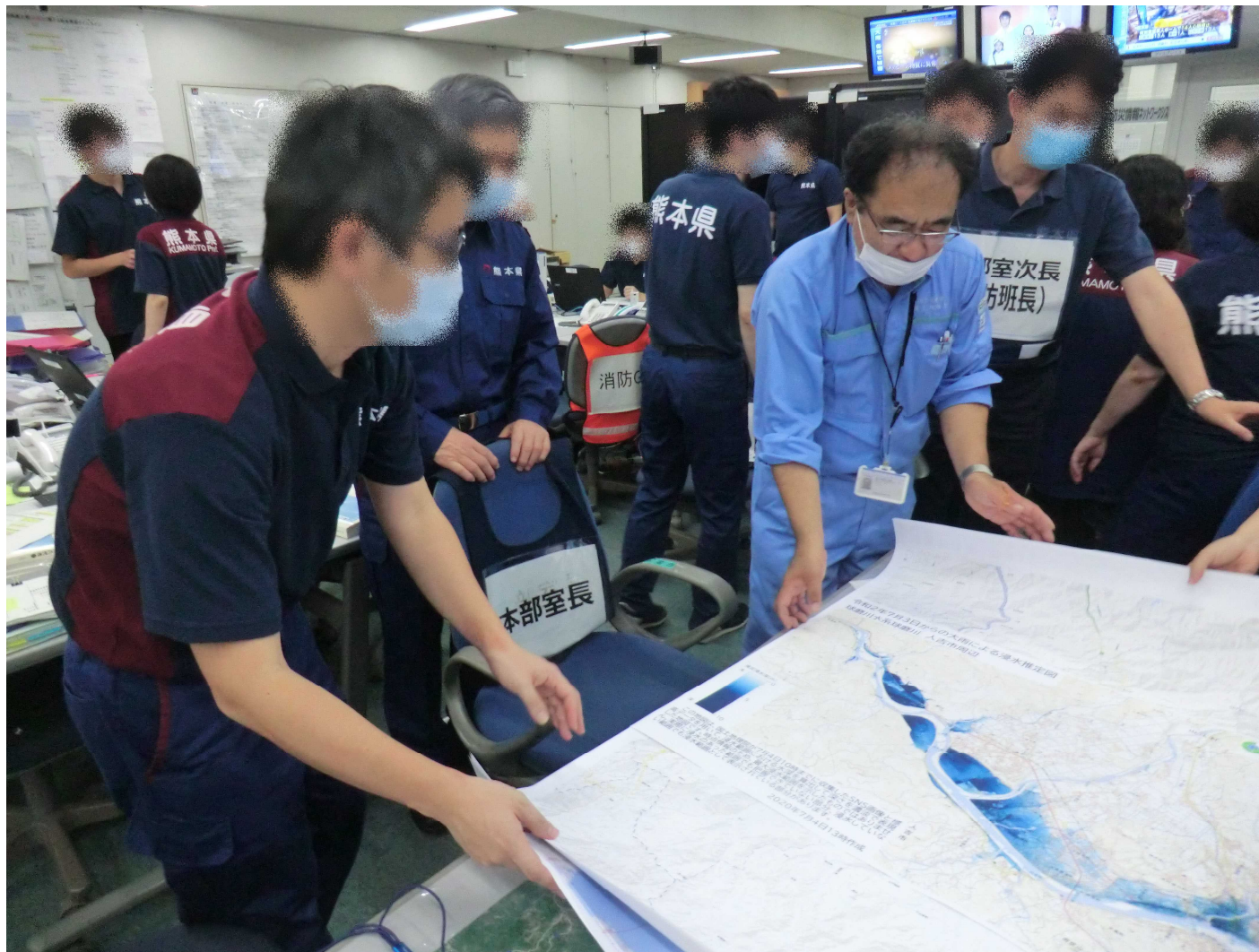
【熊本県庁】 提供した浸水推定図について説明する隊員（写真右）7月4日撮影

国土地理院TEC-FORCE（リエゾン）は熊本県災害対策本部に地理空間情報の提供を実施しました。