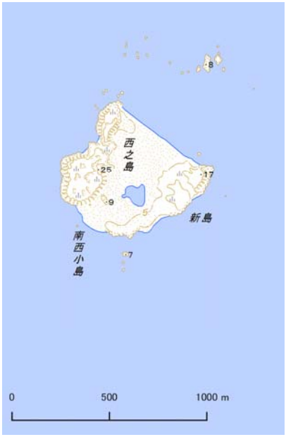
平成4年発行の地形図