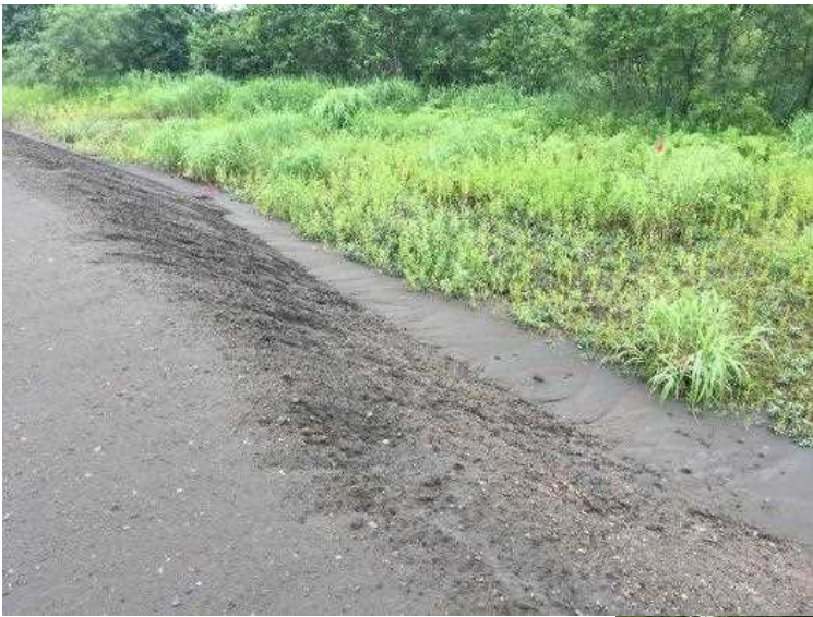
7月16日の豪雨で法面一部流失