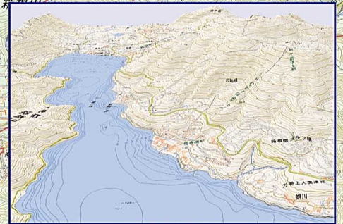
3D 模型 (地理院地図)