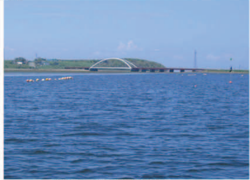
温根沼から望む温根沼大橋

温根沼について 温根沼は、北海道根室市に位置する面積5,680㎡の湖沼で、温根沼大橋を境に根室湾へ流れる汽水湖です。平潮時には沖合まで干涸び広がるなど、酒類以外では全体的に浅く、水深1～2mの範囲ではアサギが大量に繁殖しており、アサギ、カキ、北海シマエビなど海産物の漁場及び養殖場となっています。 また、野生動物も多数生息しており、特に鳥類では環境省レッドリスト絶滅危惧Ⅱ種のタンチョウが生息しています。このように、良好な自然環境が保たれた温根沼は、北海道が定める「野付保護区立自然公園」に含まれています。また、2001年（平成13年）には、環境省が定める「日本の重要湿地500」に選定されています。しかし、近年、1994年（平成6年）北海道東方沖地震や2002年（平成15年）十勝沖地震の影響等による地震の沈下やそれに伴う海水の浸入の影響により、湖岸では木の立ち枯れや倒木が目につきます。