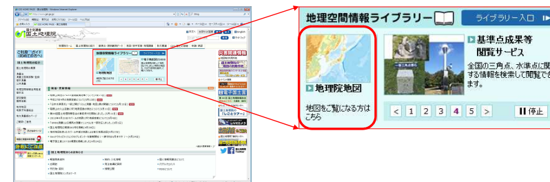
国土地理院トップページ ( http://www.gsi.go.jp/ )