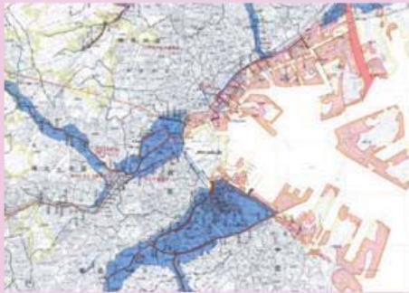
浸水の恐れのある区域の把握、復旧作業に対応した機動的対応