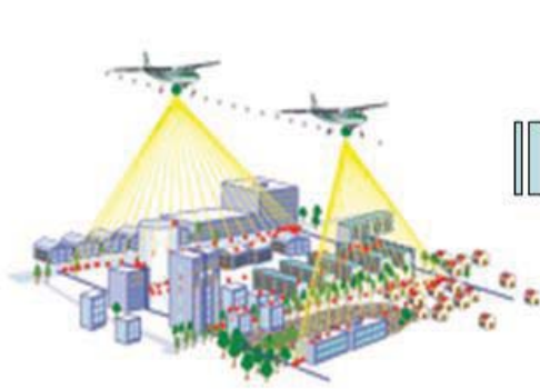
地表面に向けてレーザ光を発射