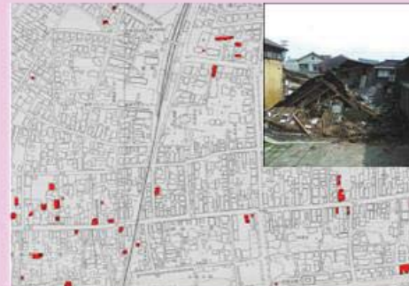
2時期のデータを比較し災害調査に活用