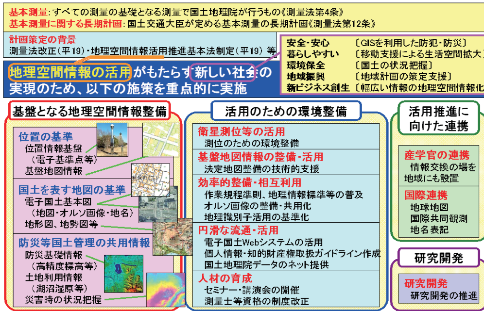
図－1 基本測量に関する長期計画の概要 ー測量・地図行政から地理空間情報活用推進行政へー

ことによりもたらされる新しい社会（地理空間情報高度活用社会）の展望として、以下の5つの社会を示すとともに、その具体像を示している。