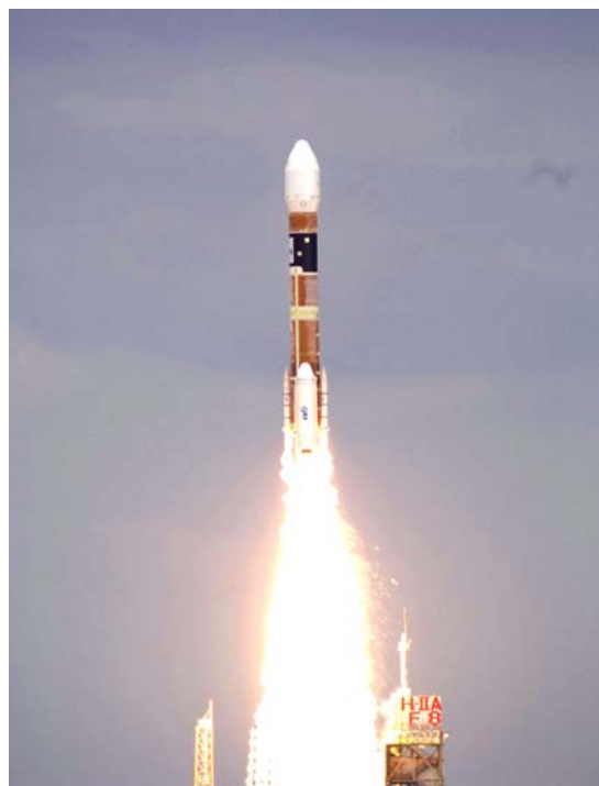
写真－1 「だいち」打ち上げ

人工衛星を利用した宇宙からの地球観測は、広い範囲を一度に観測でき、また、海外や災害発生場所など地上からの観測が困難な場所についても地表の情報を取得できるため、効率的な地理情報の収集や緊急時の災害状況の把握に力を発揮する。国土地理院と宇宙航空研究開発機構では、2006年1月に打ち上げられた国産の人工衛星「だいち」を活用すべく、共同研究を実施している。「だいち」には、地表を画像化する2種類の光のセンサと電波で画像化するセンサの3種類の観測機器が搭載されている。光のセンサは、各種地理情報の取得や地形図の修正に利用でき、電波のセンサは地表の動き（地殻変動）を捉えるのに役立つ。国土地理院では、これらのセンサを3種類とも様々な目的で活用する。