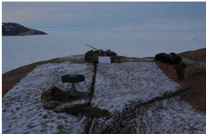
刺針写真 Pricking Photograph