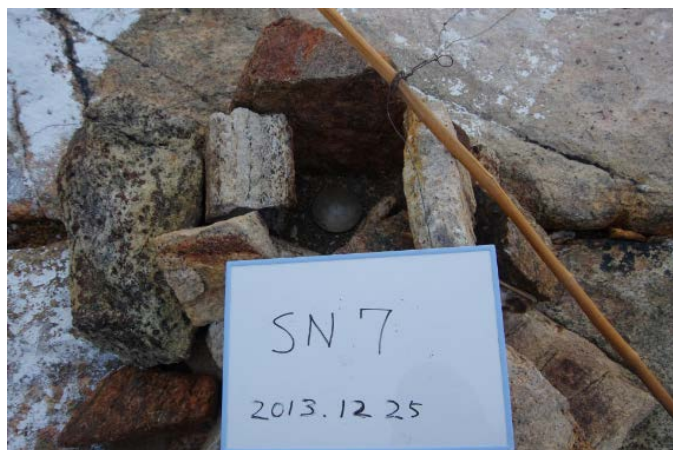
地上写真 Ground Photograph