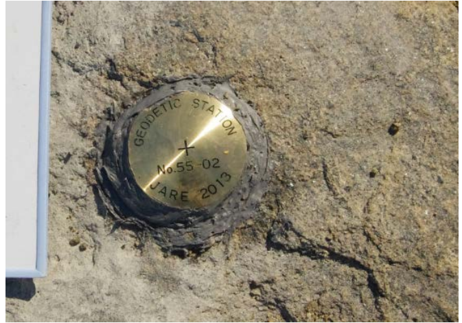
地上写真 Ground Photograph