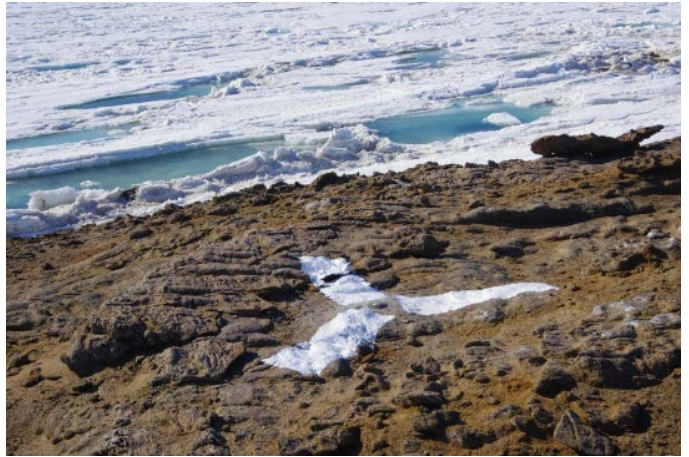
対空標識写真 Airphoto Signal Photograph