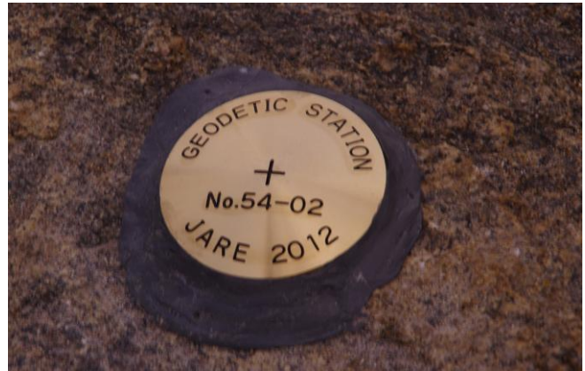
地上写真 Ground Photograph