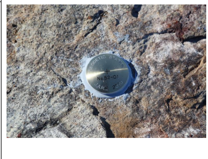
地上写真 Ground Photograph