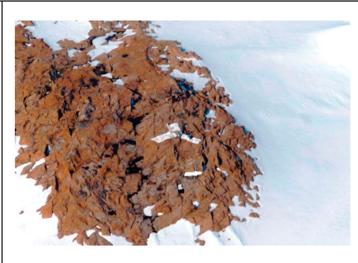
刺針写真 Pricking Photograph