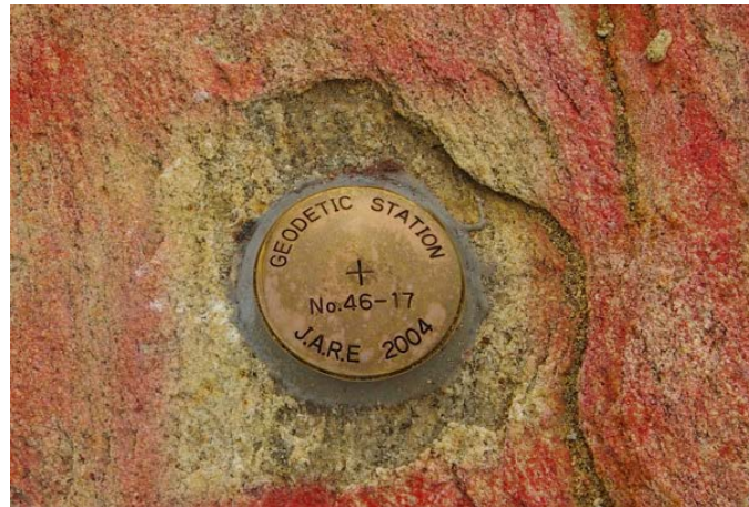
地上写真 Ground Photograph