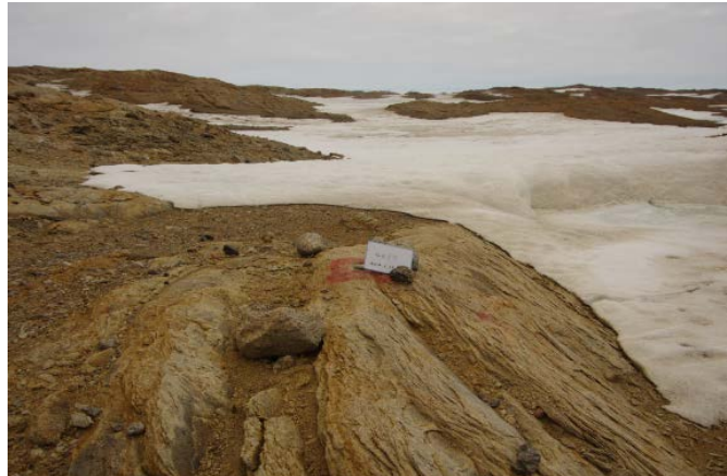
刺針写真 Pricking Photograph