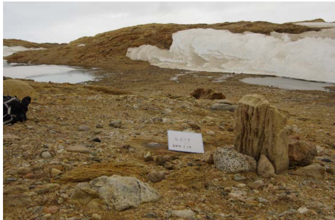
刺針写真 Pricking Photograph