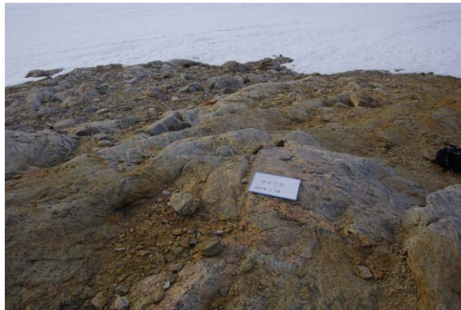
刺針写真 Pricking Photograph