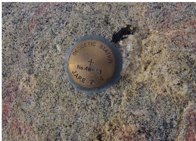
地上写真 Ground Photograph