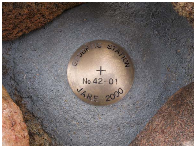
地上写真 Ground Photograph