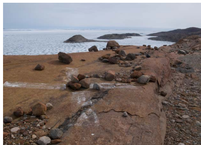
刺針写真 Pricking Photograph