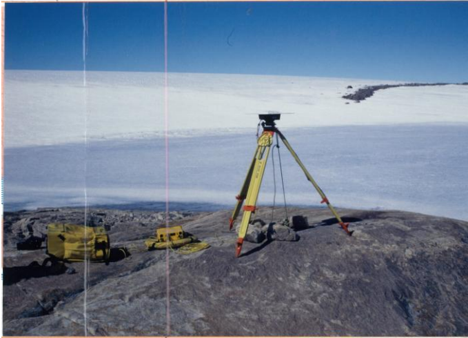
刺針写真 Pricking Photograph