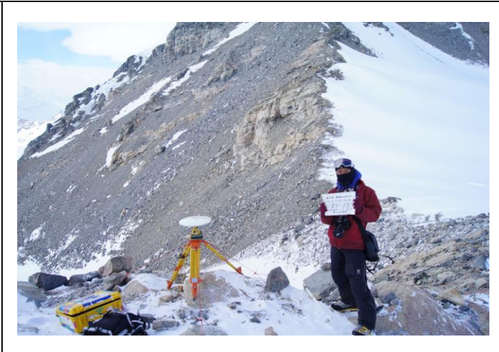
刺針写真 Pricking photograph