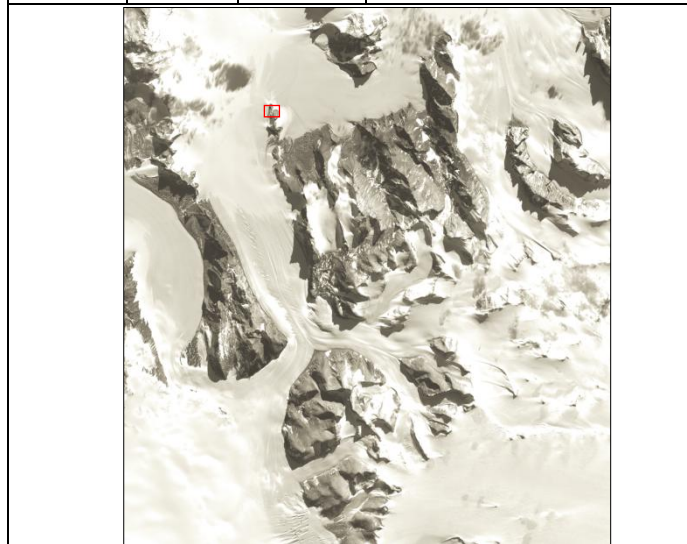
拡大 Zoom in