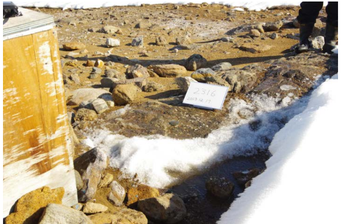
対空標識写真 Airphoto Signal Photograph