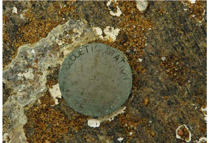
地上写真 Ground Photograph