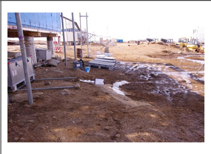
対空標識写真 Airphoto Signal Photograph