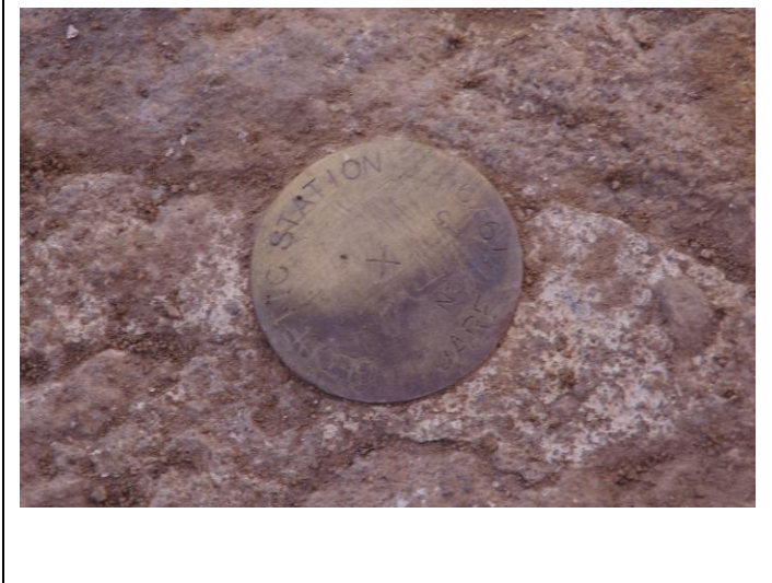
地上写真 Ground Photograph