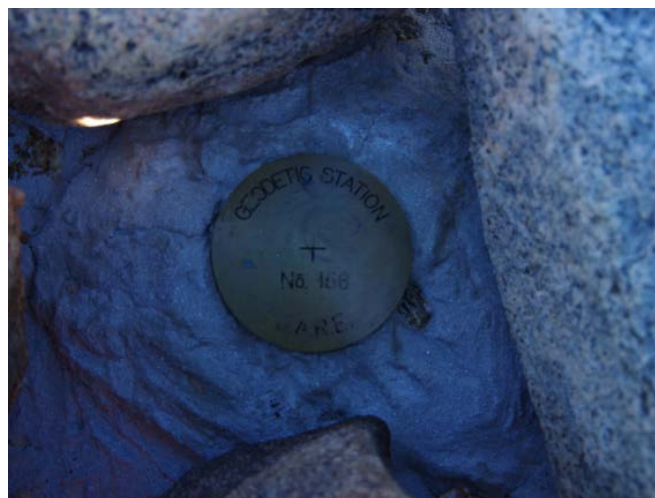
地上写真 Ground Photograph