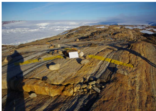
刺針写真 Pricking Photograph