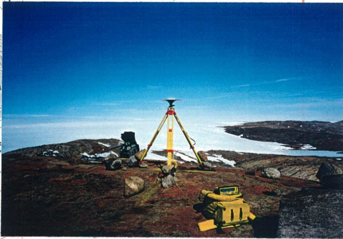
刺針写真 Pricking Photograph