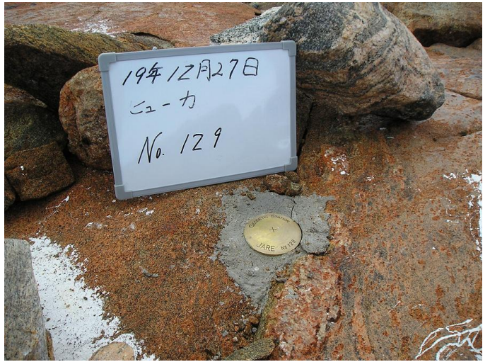
地上写真 Ground Photograph