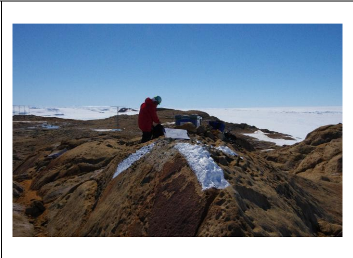
対空標識写真 Airphoto Signal Photograph