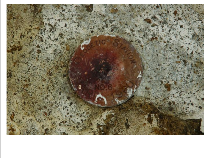
地上写真 Ground Photograph