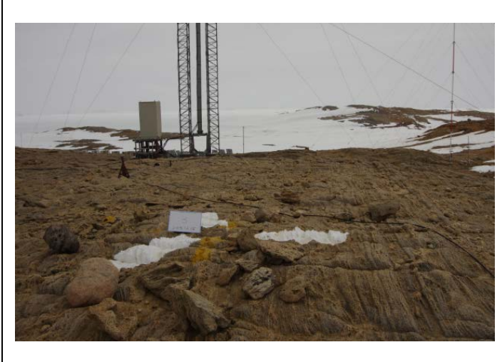
対空標識写真 Airphoto Signal Photograph