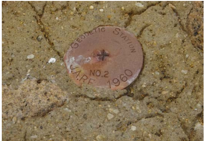
地上写真 Ground Photograph