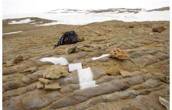
対空標識写真 Airphoto Signal Photograph