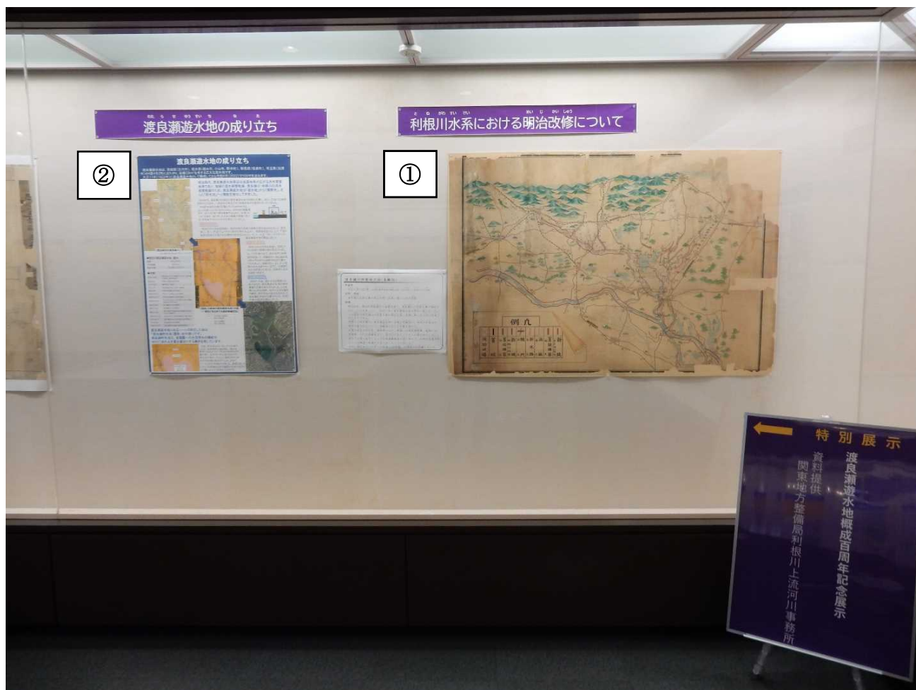
①渡良瀬川改修竣工図（鳥瞰図）