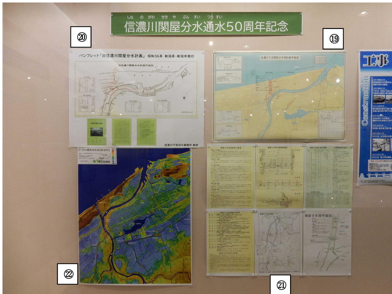
①9信濃川下流関屋分水路計画平面図