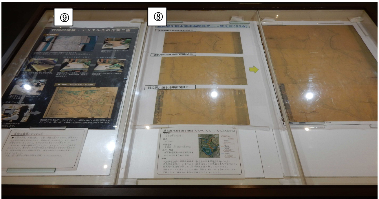
⑧渡良瀬川遊水池平面図其之一、其之二、其之三