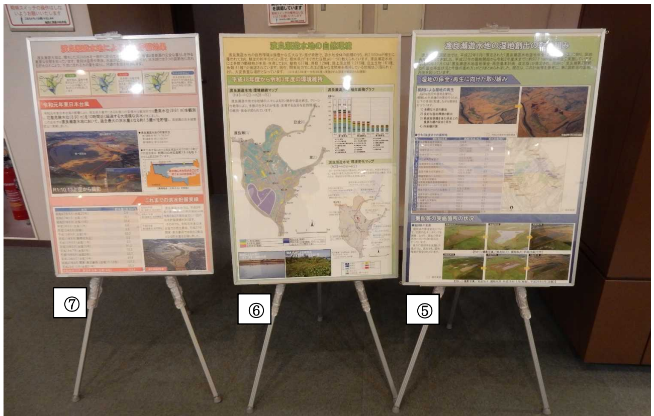
⑤パネル（渡良瀬遊水地の湿地創出の取り組み）