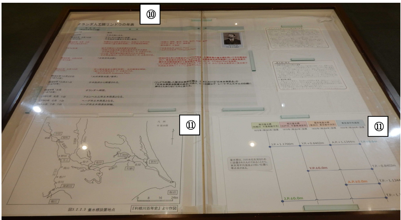
⑩オランダ人工師リンドウの量水標の設置（年表）