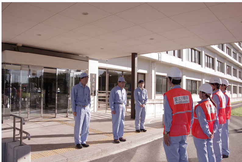
■被害状況調査班(UAV)の出発式 (国土地理院本院(つくば市) 10月13日撮影)