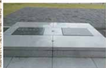
日本経緯度原点 (東京都港区)