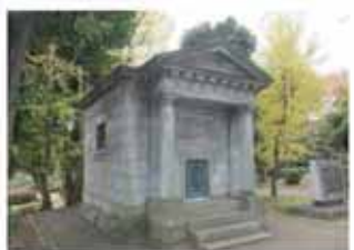
日本水準原点 (東京都千代田区)