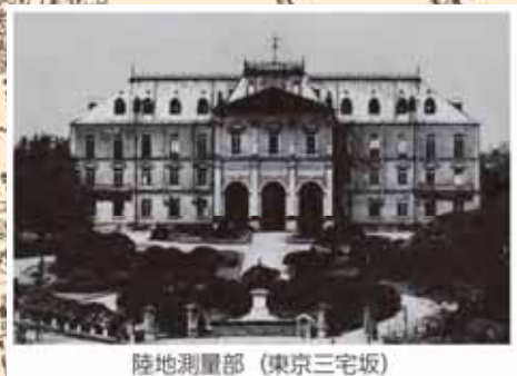
陸地測量部 (東京三宅坂)