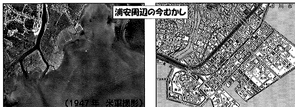
浦安周辺の今むかし