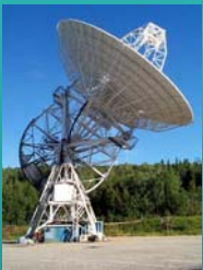
アラスカ フェアバンクスVLBI観測局