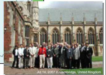
地球地図国際運営委員会 (ISCGM)